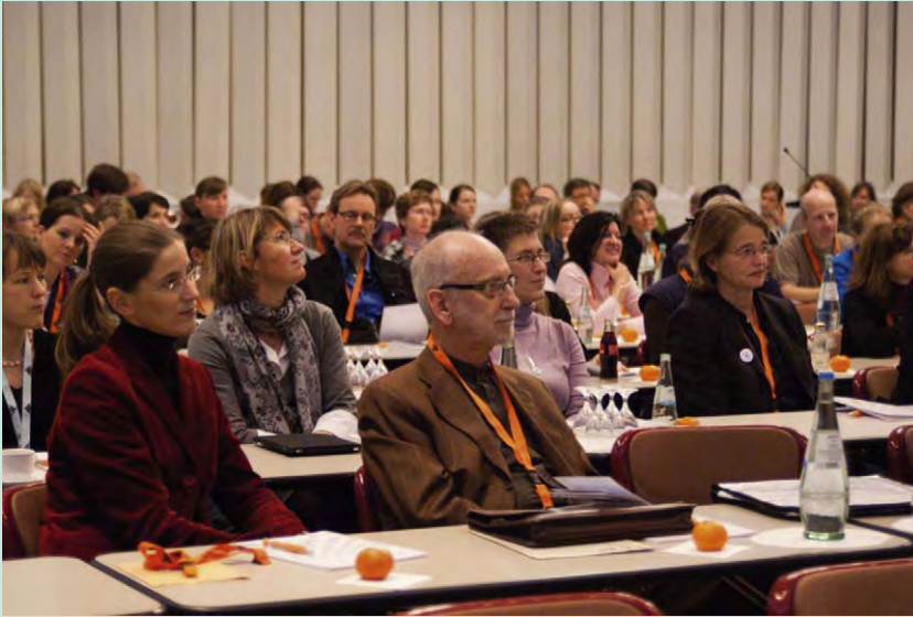
Abb. 2. Rund 320 Personen aus der Krankenhausapotheke, der öffentlichen Apotheke, aus Universitätsinstituten und der pharmazeutischen Industrie bekamen in Plenar- sowie zahlreichen Kurzvorträgen, aber auch in Workshops und in der Posterausstellung ein informatives Programm zum Thema Arzneimittelinformation geboten.